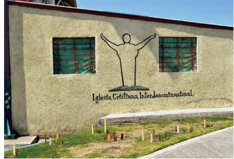
Capilla interdenominacional dentro del CEVARESO.

para practicar el culto a la Santa Muerte o al diablo y la santería son las celdas y los pasillos, espacios cuyo acceso no es público y se mantienen ocultos a la vista de los familiares y de otras autoridades. Es una forma de encubrir dentro de la prisión este tipo de religiosidades, que son parte de un estigma negativo pues se consideran que son propias de internos que no han cambiado su conducta delictiva.