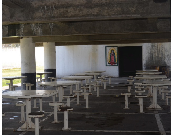
Comedor en una zona del CEVARESO.

las celdas se puede corroborar cuál interno tiene dinero y cuál no, ya que algunas tienen televisiones, colchones, repisas; es decir que aunque los espacios están pensados y diseñados para determinada forma de convivencia, los internos hacen sus propios ajustes y dejan marcada su identidad.