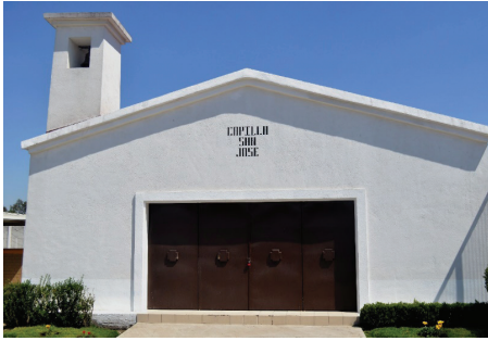
Capilla católica dentro del CEVARESO.