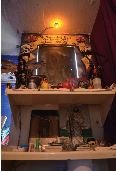
Altares en las repisas de una celda en el CEVARESO.