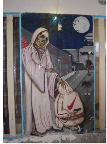
Mural a la Santa Muerte en un pasillo dentro del CEVARESO.

del santo; esta actividad es una forma de resistencia al control carcelario, puesto que esos espacios se diseñaron originalmente para colocar pertenencias personales, como la ropa, y los internos se los apropian con sus creencias y prácticas religiosas.