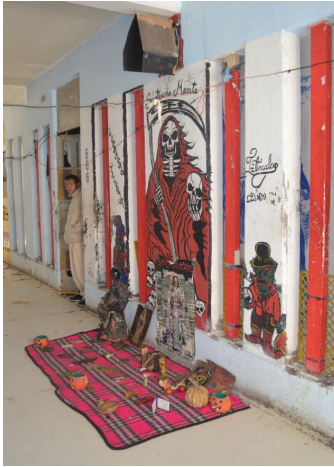
Altar a la Santa Muerte dentro de un pasillo en el CEVARESO.